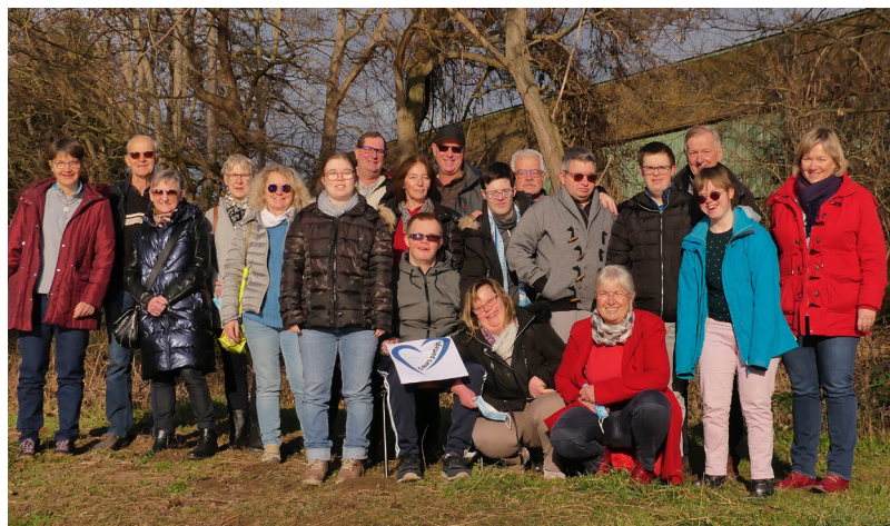
Les jeunes et leurs parents.

En réflexion depuis de nombreuses années, un groupe de parents de jeunes adultes avec déficience intellectuelle (trisomie et autres affections mentales), a pris à bras le corps, depuis 2018, l'idée de création d'un habitat inclusif.